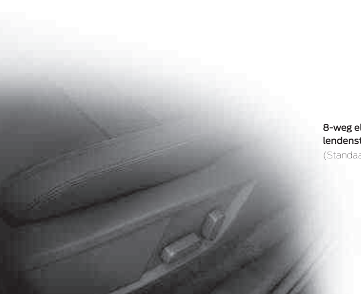
8-weg elektrisch verstelbare bestuurderszetel met lendensteun (Standaard)